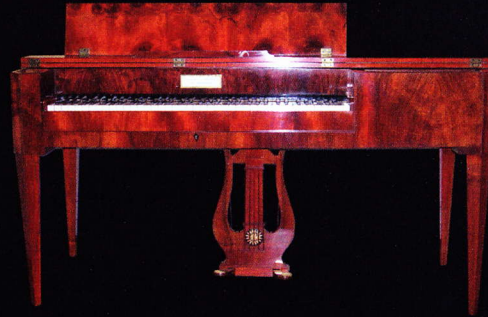
pianoforte carré Dieudonné et Schiedmayer Suttgart, vers 1810