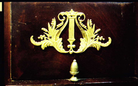
Bronze, pianoforte carré Johann Fritz, Vienne, vers 1820

CONSERVATOIRE DE MUSIQUE DE GENÈVE, Place Neuve • 1204 Genève