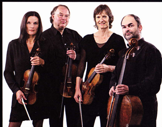
Quatuor Mosaïques